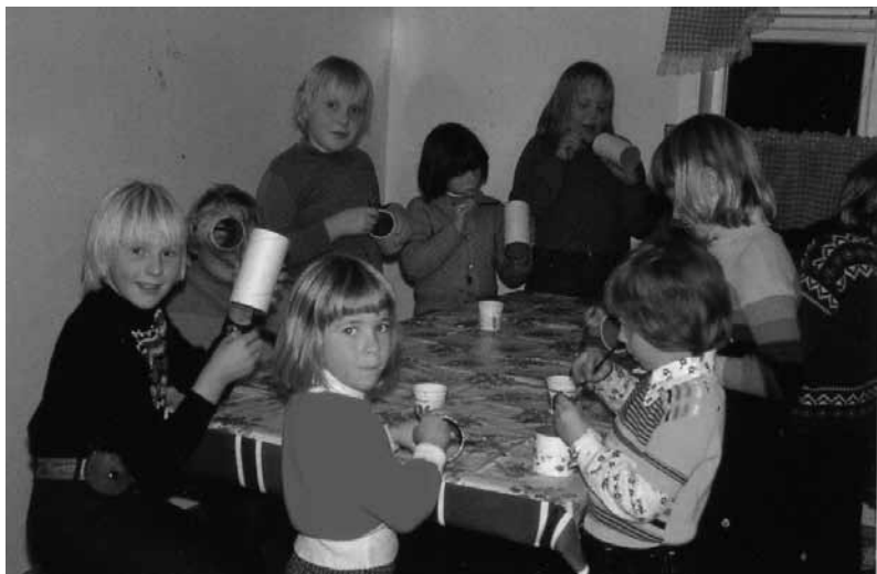
I full aktivitet!