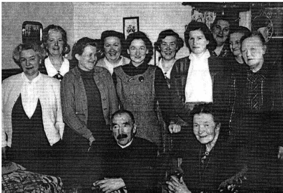
Misjonsforeningen i Nordkil omkr 1955.