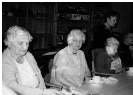
Foreningsmøte på Trivelsstua på Bygdeheimen.