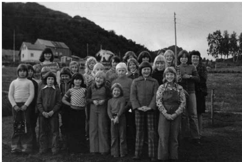
Barnas misjonsklubb i Røsvik.