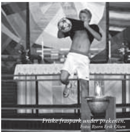
Friske fraspark under prekenen.