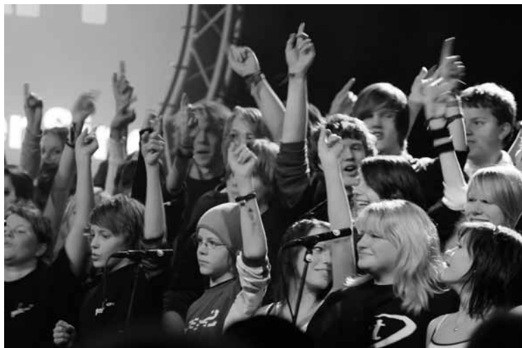
Hamarøy Ten Sing på ”Bynatta”!

Etter Hamarøynatta i år ble Hamarøy Ten Sing invitert til å opptre på den aller første Bynatta i Bodø. Bynatta er Bodø-menighetenes svar på Hamarøynatta. Tilsammen samlet arrangementet 650 unge deltakere.