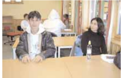
Kjærlighet i ulike kulturer

1. Kjærlighet i ulike kulturer. Her møtte gruppen fremmedspråkklassen til samtale om arrangerte ekteskap og ulike erfaringer og syn på kjærlighet.